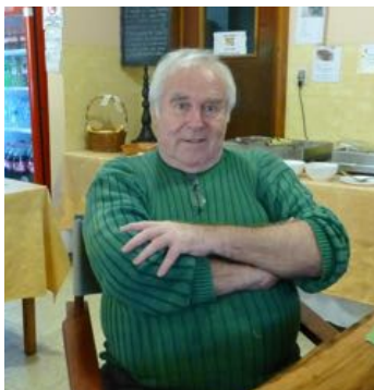
Absent heute (siehe auch Beilage 01 und www )

ca. 19.30 Uhr Absent-Stamm im urchigen Gewölbekeller mit exklusiver Präsentation von Absent zu seinen "50 Jahre 'absent', sein wirken in der Welt, aktuell in Paraguay" dazwischen Canti und Colloquien, Produktionen etc